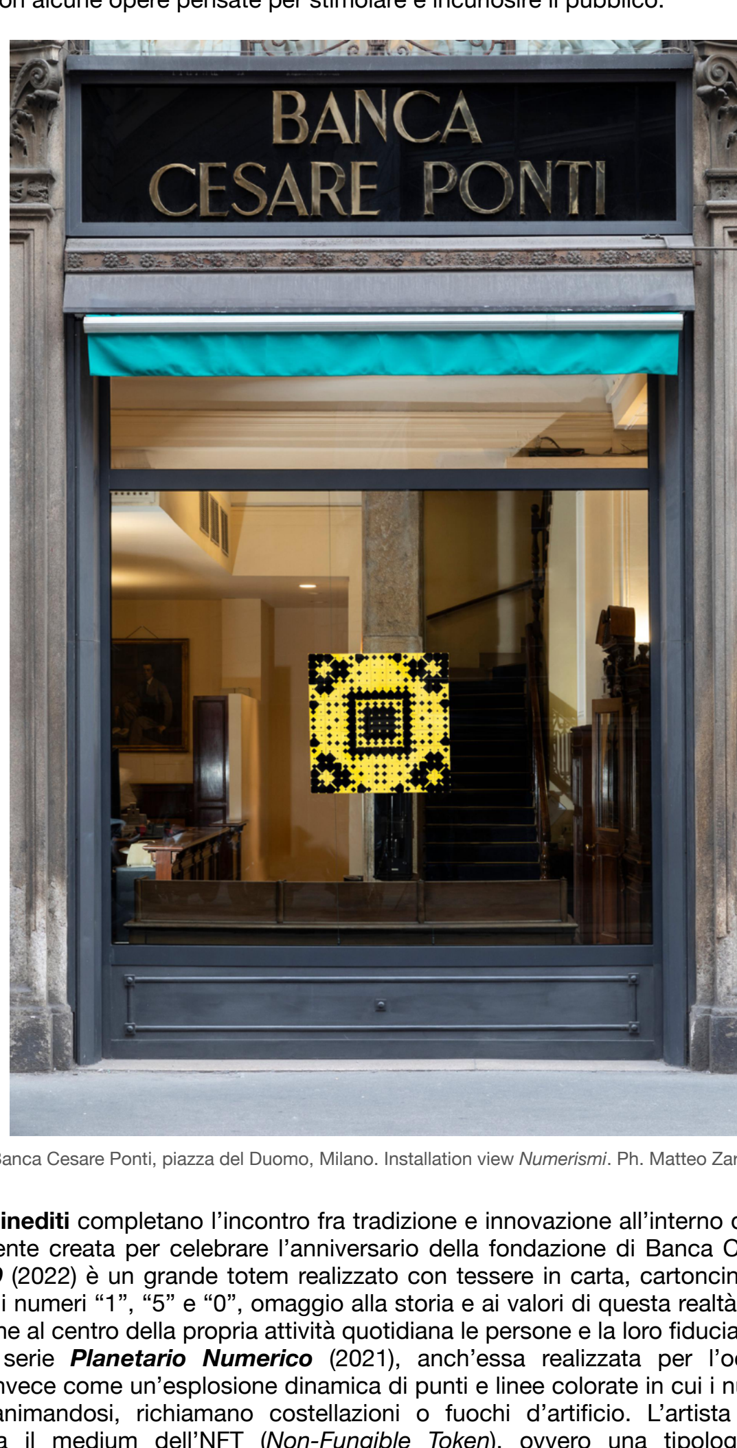
Banca Cesare Ponti, piazza del Duomo, Milano. Installation view Numerismi.

Ad aprire il percorso quattro Neometrie (2016), ovvero mosaici dai colori accesi e sgargianti nei quali la cifra numerica scompare visivamente per diventare la matrice moltiplicativa che permette di generare infinite combinazioni in cui ogni tessera è uguale e allo stesso tempo diversa dalle altre. Alcune Neometrie , posizionate in vetrina per interagire con i passanti, nel corso della mostra saranno modificate dall'artista, variate nel loro aspetto con cadenza mensile, dando vita a una percezione dell'opera sempre nuova. Il percorso propone inoltre una selezione di opere tratte dalla serie Numerage (2014-2015), collage su carta con numeri da 1 a 100 ritagliati da quotidiani di tutto il mondo e, nella sala d'attesa, sarà possibile interagire con alcune opere pensate per stimolare e incuriosire il pubblico.