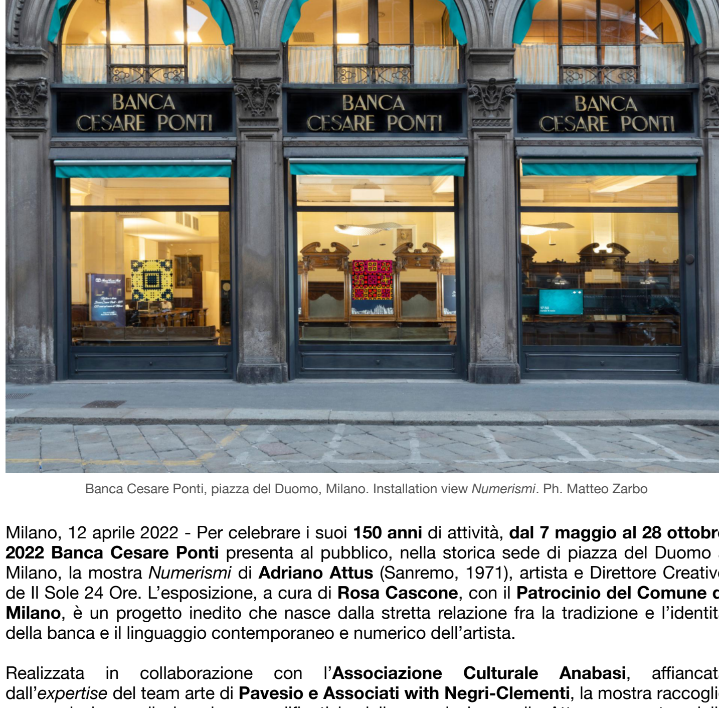
Banca Cesare Ponti, piazza del Duomo, Milano. Installation view Numerismi.

La mostra è in parte visibile al pubblico anche dalle vetrine esterne.