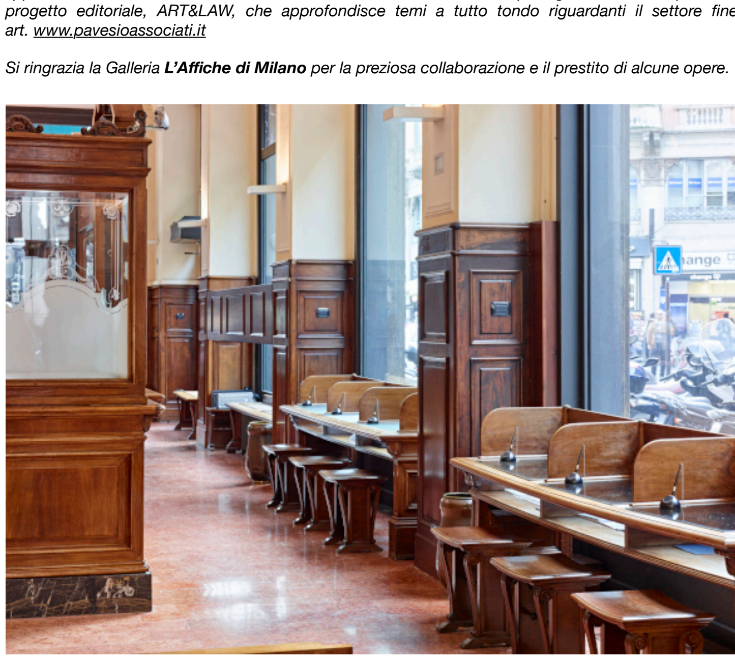
Banca Cesare Ponti, sede di Milano.

Si ringrazia la Galleria L'Affiche di Milano per la preziosa collaborazione e il prestito di alcune opere.